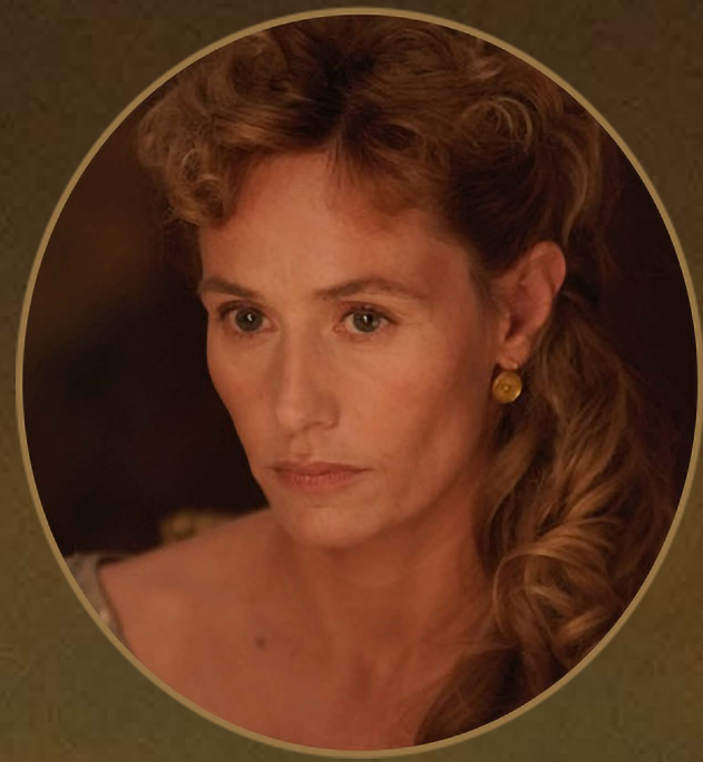
Louise de Bargeton