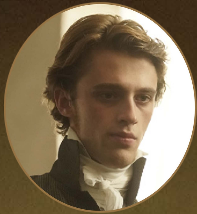
Lucien de Rubempré