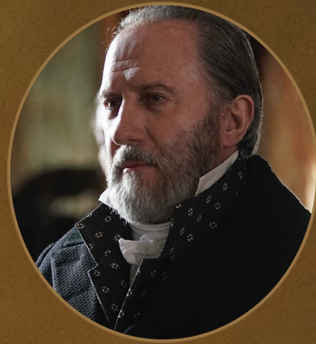
Baron du Châtelet